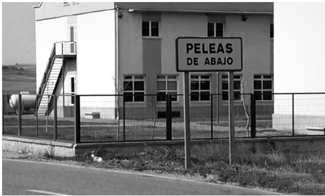
Некогда умирающий городок сегодня почувствовал, что у него может быть неплохое будущее

К концу года резиденция для престарелых людей в Пелеас-де-Абахо должна трансформироваться в специализированный центр для людей с деменцией. Это заболевание представляет собой стойкое снижение познавательной деятельности с утратой в той или иной степени ранее усвоенных знаний и практических навыков и затруднением или невозможностью приобретения новых; по сути – это то же, что и слабоумие, или – распад психических функций, происходящий в результате поражений мозга, наиболее часто – в старости.